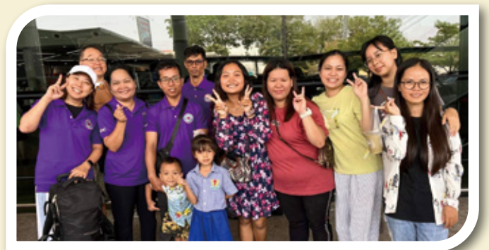
LOC同工與學生送機 (筆者：前左一)

我剛剛完成了三日兩夜的神學院「師生營」，算是開始了往後三年全職學生的生涯。請大家禱告記念我的學習，求主幫助我專心學習，按祂的心意前行。阿們。 ELCHK