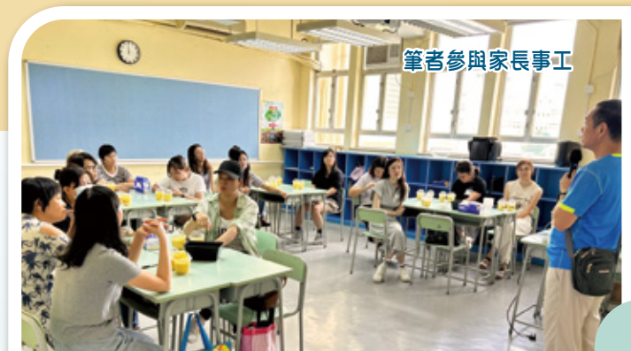
筆者參與家長事工