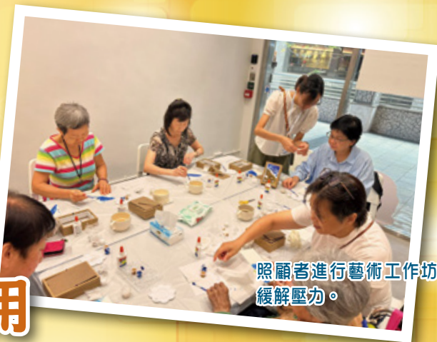
照顧者進行藝術工作坊， 緩解壓力。