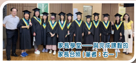
家長學堂——與完成課程的家長合照（筆者：右一）

過了不到兩星期，上帝又為我預備另一份在路德會堂會的服事，雖然不是信義會堂會，但為著仍然在信義宗教會服事而感恩。除了教會日常事務外，我還參與不同團契的活動，包括：分享我到柬埔寨宣教的心志及服事、合團燒烤、每月兩次的分組祈禱等，從而與弟兄姊妹很快熟絡起來。更重要的是，可以到所屬的幼稚園接觸學生及家長，這無疑又是為我「度身」準備的，因為我從前亦是幼稚園老師。學校每學期都會舉辦家長學堂，為家長提供不同的育兒知識；