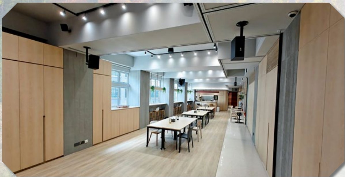
Oikos一角：一間友堂分享聚會空間的例子