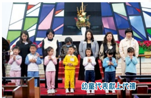
幼童代表獻上代禱