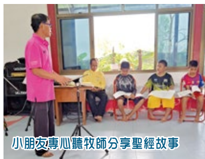
小朋友專心聽牧師分享聖經故事

謝主，這次的訪宣讓我們深刻地體會到，宣教是努力向他人傳講耶穌基督的救恩，而不是單純計較成本效益。宣教是上帝讓我們學習對他人給予愛和關懷，並將這份愛傳遞出去。