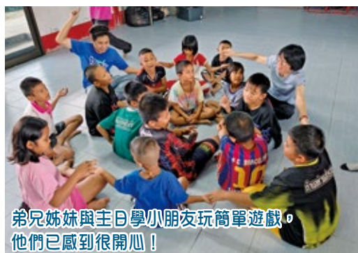
弟兄姊妹與主日學小朋友玩簡單遊戲，他們已感到很開心！