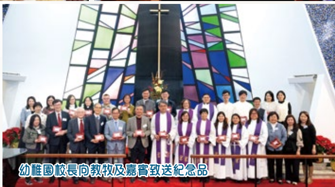
幼稚園校長向教牧及嘉賓致送紀念品