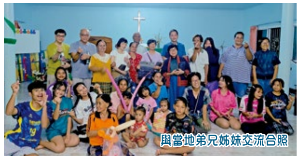
與當地弟兄姊妹交流合照

是次訪宣之旅順利完成之餘，相信我們的宣教事工會繼續向前，不會倒退。因為有前人的經驗參照，主必然指教我們如何去行，我們不會再拿著盲公竹再次摸索而浪費光陰了。