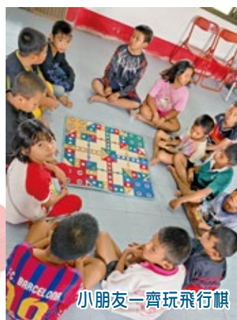
小朋友一齊玩飛行棋