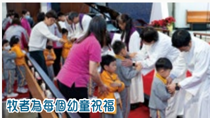
牧者為每個幼童祝福