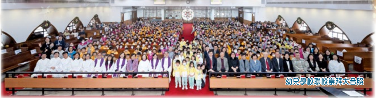
幼兒學校聯校崇拜大合照

編序：本會於二零二四年十二月十三日上午舉行七十周年會慶幼兒學校聯校聖誕崇拜，亦於下午舉行七十周年會慶幼稚園聯校聖誕崇拜。當日參與的三至六歲的幼童和家長共有一千零七十三位。本文作者為兩場崇拜的禮儀設計者和顧問，並擔任主禮。