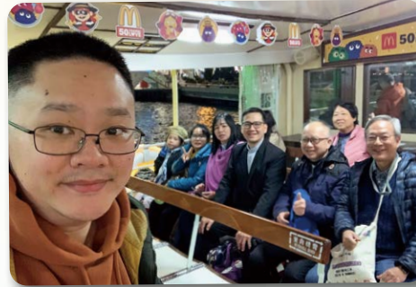
主恩堂接待喜樂堂教牧家庭與青年幹事