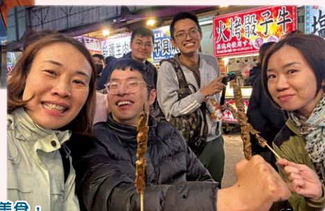
到夜市場逛及享受美食，對坐輪椅的團友來說是難得的機會。

要數無障礙旅行團最難忘的景點，不少團友均說是高美濕地。除了景色優美，還因為有一道高難度斜坡，一架輪椅需要三位強壯的團友合力推動，先推上一段約四十五度的斜坡，在有限的平地急轉彎，再後退落一段同一斜度的斜坡。過程中職員都滴著汗水推輪椅，只為了不想團友錯過欣賞美景的機會，大家都能在旅程留下倩影。