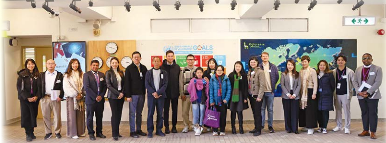
越南喜樂堂教牧家庭與青年幹事於宏信堂參與主日崇拜