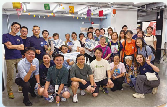
信義一家，同心服侍「新田部屋」的居民。

我相信不只「部屋」，本會其他單位或學校也是上帝給我們重要的福音禾場！不過，各堂會都有各自的牧養及福音工作，所以若單憑一間堂會去承擔另一個禾場，承载力實在有限。就「部屋」而言，若能建立一個「福音事工統籌小組」為「部屋」制訂整年的事工計劃或安排，並連繫不同堂會一起合作，這樣就能發揮更大的力量，彼此服侍，互相支持，互補不足，實現「一個教會」同心合意興旺福音的美麗願景。