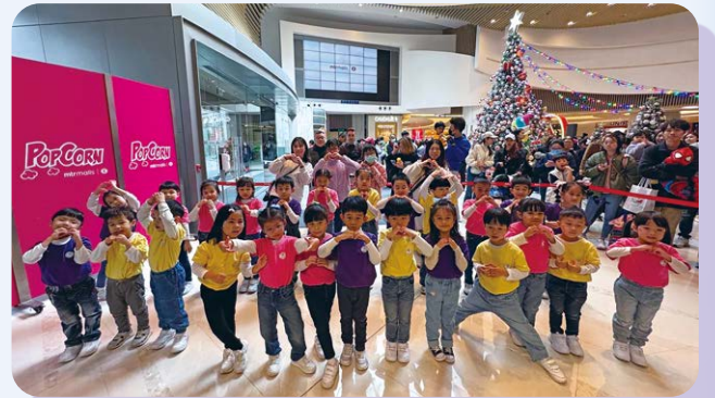
堂社校小孩子和少年人於二零二四年十二月十四日在將軍澳廣場獻唱詩歌。