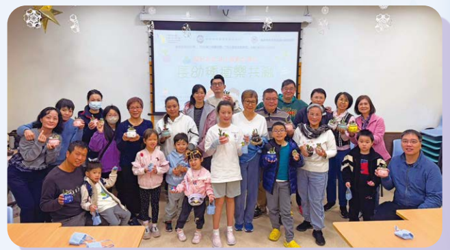
二零二五年一月四日堂社校一同舉辦「50+ 幫緊你幫緊理」長幼種植樂共融活動。