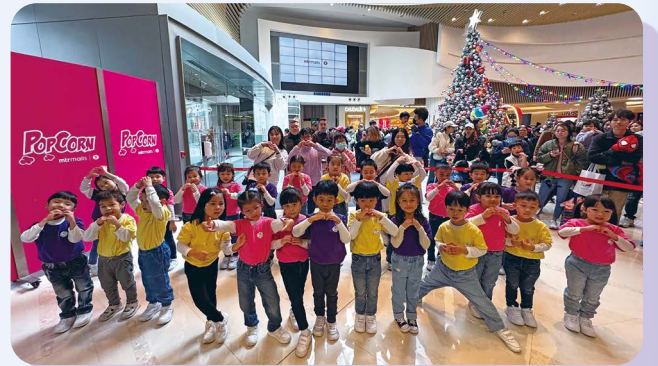
堂社校小孩子和少年人於二零二四年十二月十四日在將軍澳廣場獻唱詩歌。