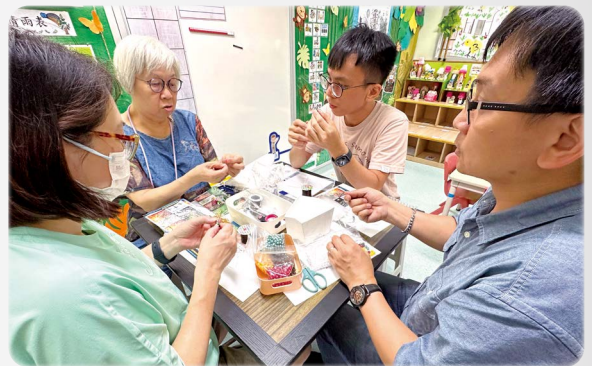
弟兄姊妹一起製作五色珠給堂會佈道之用

五色的象徵意義各有不同，各自代表著福音中重要的真理： 綠色 ：象徵上帝的創造； 黑色 ：象徵人類的罪； 紅色 ：象徵耶穌基督寶血的救贖。 白色 ：象徵藉基督稱義、潔淨和罪得赦免。 金色 / 黃色 ：象徵基督的榮耀及永生。