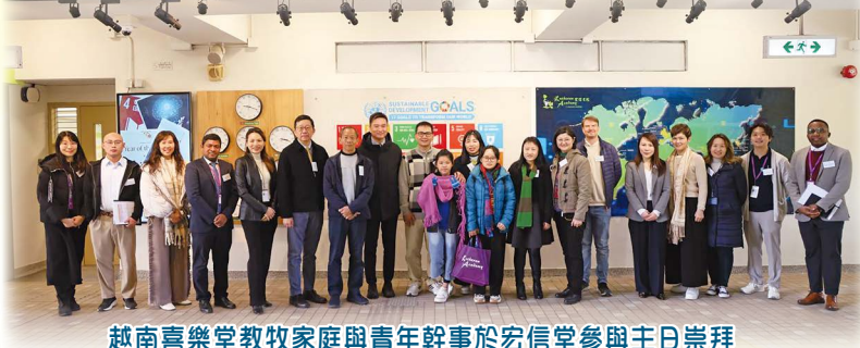
越南喜樂堂教牧家庭與青年幹事於宏信堂參與主日崇拜