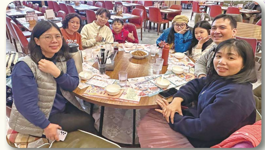
天恩堂接待喜樂堂教牧家庭與青年幹事