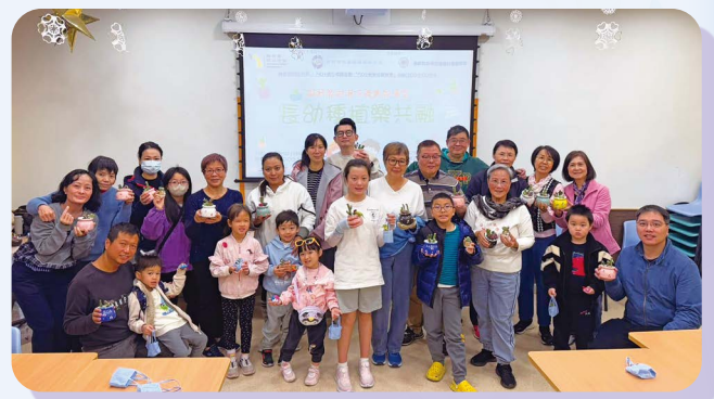
二零二五年一月四日堂社校一同舉辦「50+ 幫緊你幫緊理」長幼種植樂共融活動。