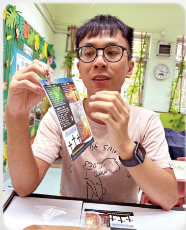
五色佈道用於個人佈道

五色佈道法的起源可追溯到二十世紀的美國，它結合了英國佈道家司布真一八六六年的黑、紅、白三色無字書佈道法、美國佈道家慕迪一八七五年再添加的金色 / 黃色的四色無字書，以及一九三七年美國歐爾文夫婦再添加綠色的五色無字書，亦即今天的五色佈道法。五色佈道法是為了幫助信徒能夠使用簡單易明的方式與他人分享福音，使其更易於理解和記憶。這種方法特別適合向兒童、青少年、長者及未曾接觸福音的人士使用，因為以顏色來表達象徵意義是比較容易讓人有深刻印象。