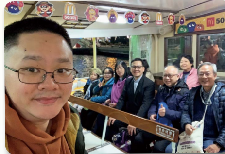
主恩堂接待喜樂堂教牧家庭與青年幹事