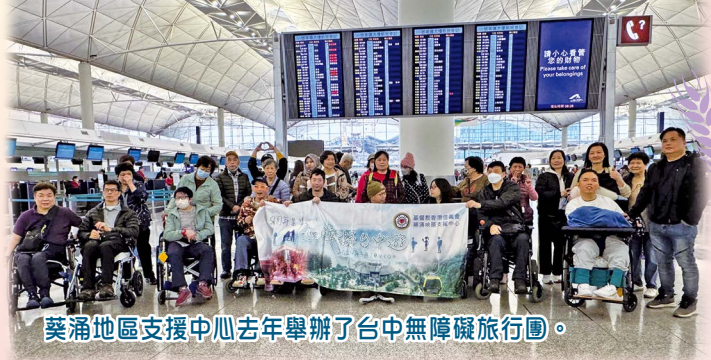
葵涌地區支援中心去年舉辦了台中無障礙旅行團。