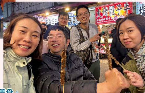
到夜市閒逛及享受美食，對坐輪椅的團友來說是難得的機會。

要數無障礙旅行團最難忘的景點，不少團友均說是高美濕地。除了景色優美，還因為有一道高難度斜坡，一架輪椅需要三位強壯的團友合力推動，先推上一段約四十五度的斜坡，在有限的平地急轉彎，再後退落一段同一斜度的斜坡。過程中職員都滴著汗水推輪椅，只為了不想團友錯過欣賞美景的機會，大家都能在旅程留下倩影。