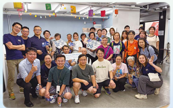
信義一家，同心服侍「新田部屋」的居民。

我相信不只「部屋」，本會其他單位或學校也是上帝給我們重要的福音禾場！不過，各堂會都有各自的牧養及福音工作，所以若單憑一間堂會去承擔另一個禾場，承载力實在有限。就「部屋」而言，若能建立一個「福音事工統籌小組」為「部屋」制訂整年的事工計劃或安排，並連繫不同堂會一起合作，這樣就能發揮更大的力量，彼此服侍，互相支持，互補不足，實現「一個教會」同心合意興旺福音的美麗願景。